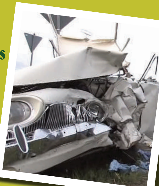
Pech- vogel des Monats