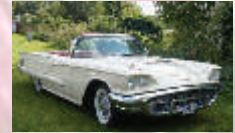
Ford Thunderbird 1960