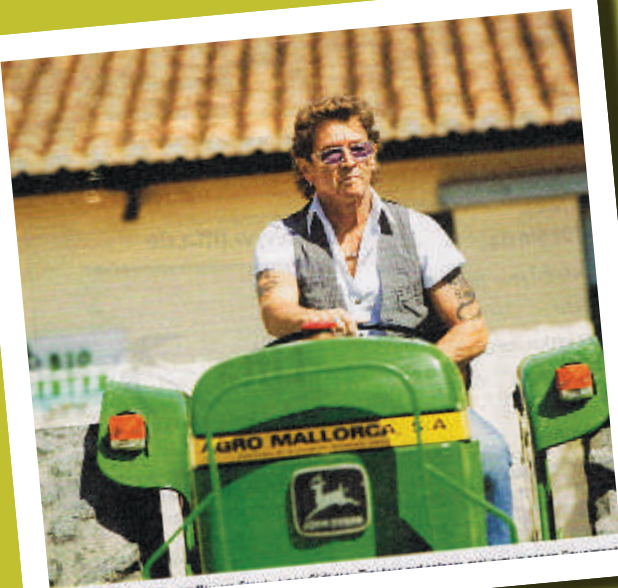
Fan des Monats